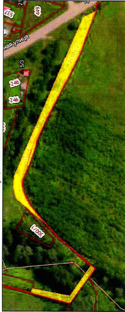
Описание границ смежных землепользователей

ЗУ3(1): -от т.29 до т.37 земельный участок с кадастровым номером 59:12:04900000:271; ЗУ3(2): -от т.38 до т.39, от т.39 до т.40, от т.40 до т.41, от т.41 до т.42, от т.42 до т.43, от т.43 до т.44, от т.44 до т.45, от т.45 до т.46, от т.46 до т.47, от т.47 до т.48, от т.48 до т.49, от т.49 до т.50, от т.50 до т.51, от т.51 до т.52, от т.52 до т.53, от т.53 до т.54, от т.54 до т.55, от т.55 до т.56, от т.56 до т.57, от т.57 до т.58, от т.58 до т.59 земельный участок с кадастровым номером 59:12:00000000:21103.