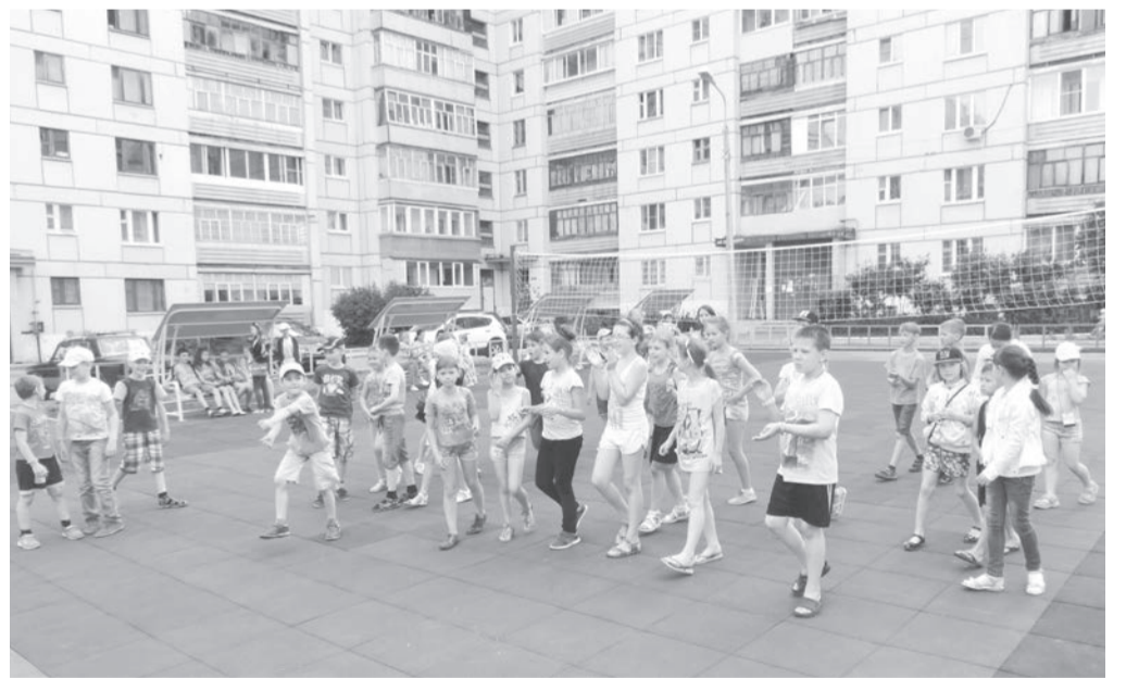
Волейбольная площадка на ул. Сосновой, 19