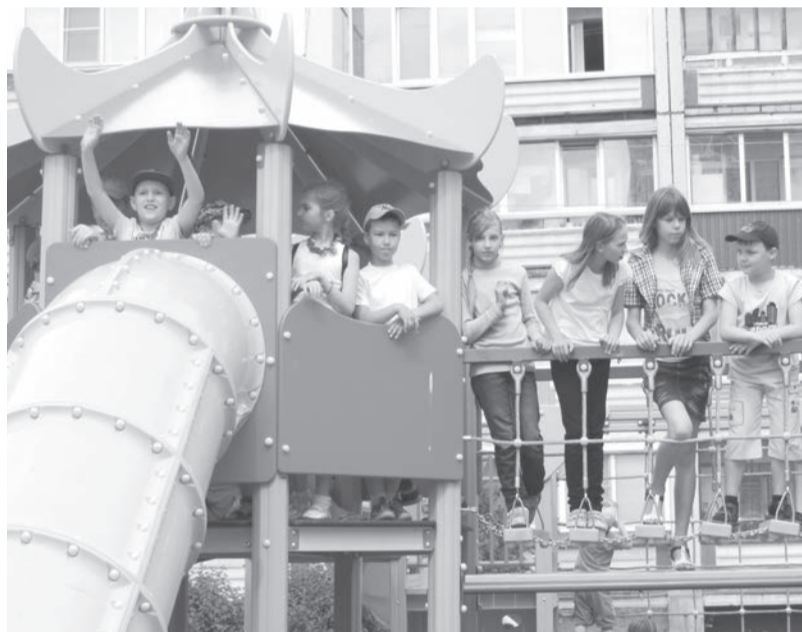
Конструкция на детской площадке «Каскад»

«Каскада» оказалась весьма существенной. Чтобы заявиться в приоритетный региональный проект по данному объекту, администрация городского поселения должна была внести свою долю в объёме 1 миллиона 339 тысяч рублей. Своих денег в бюджете не хватало. И большую часть средств – 800 тысяч рублей – добавили нефтехимики. В результате удалось привлечь около 4 миллионов рублей краевых денег и построить, без преувеличения, очень «крутую» детскую площадку. В неё органично вписалась и оригинальная волейбольная площадка, вымощенная плитками из полиуретана.