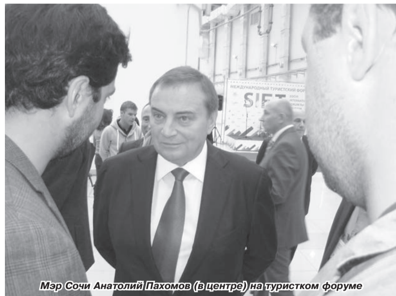
Мэр Сочи Анатолий Пахомов (в центре) на туристском форуме

обширная экскурсионная программа, организованные для нас совершенно бесплатно администрацией Сочи, – всё без натяжки тянуло на «отлично».