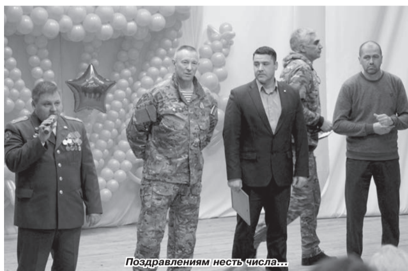
Поздравлениям несть числа...