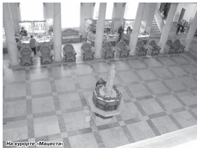
На курорте «Мацеста»

Именно посещение бальнеологического курорта «Мацеста» мне больше всего запомнилось. Когда ехали сюда, на склоне горы мы увидели скульптурное изображение юной, прекрасной горянки Мацесты. Есть даже целая легенда, почему именно она стала символом целебных сил этой воды. Но лучше более подробно расскажем о реальной истории.