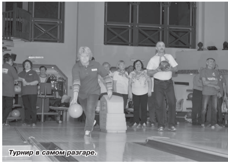
Турнир в самом разгаре.

В начале декабря ветераны из шести производственных филиалов и администрации ООО «Газпром трансгаз Чайковский» провели в корпоративном боулинг-центре «Золотой шар» ежегодный командный турнир по боулингу, который этом году был посвящён 15-летию ветеранской организации и 70-летию Великой Победы.