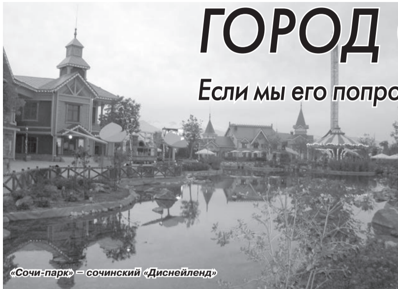
«Сочи-парк» – сочинский «Диснейленд»

Если мы его попросим заменить турецкий берег на наш «Открытый юг»