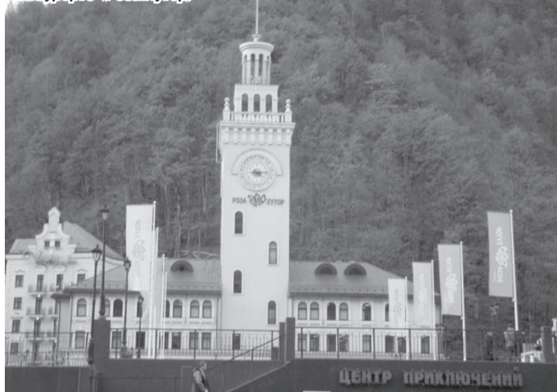
На курорте «Роза Хутор»