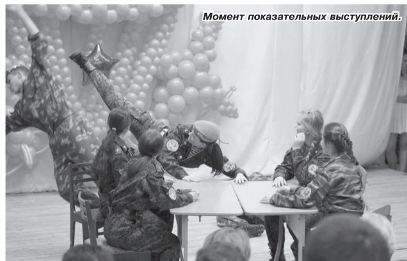
Момент показательных выступлений.