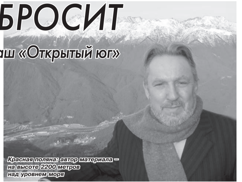
Красная поляна: автор материала – на высоте 2200 метров над уровнем моря

ярким и полным контрастов. Особо впечатлила инфраструктура Сочи, построенная для Олимпиады, потрясаяще изменившая его облик и сегодня сделавшая курорт настоящим мегаполисом. Достаточно сказать, что в той же Имеретинской долине, где раньше хозяйствовали местные совхозы, благодаря реализации Олимпийского проекта, построена не только масса новых, недорогих отелей с широкими перспективами, но создана совершенно новая зона отдыха с самой протя-