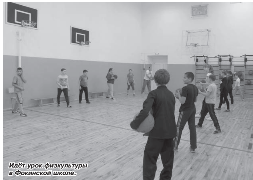
Идёт урок физкультуры в Фокинской школе.