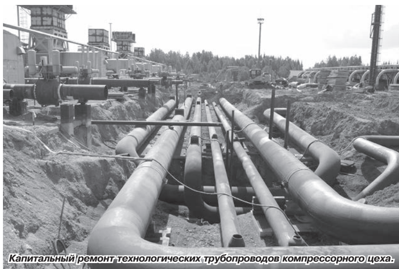
Капитальный ремонт технологических трубопроводов компрессорного цеха.

В ООО «Газпром трансгаз Чайковский» завершили работу комиссии по проверке готовности объектов и сооружений предприятия к эксплуатации в осенне-зимний период 2016-2017 годов. В конце октября все филиалы предприятия получили паспорта готовности к работе в период пиковых нагрузок.