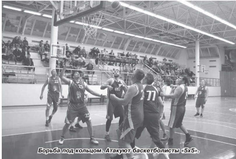
Борьба под кольцом. Атакуют баскетболисты «5х5».

Третьего февраля в Чайковском состоялось совещание по оптимизации производственных процессов газотранспортной системы ПАО «Газпром» в зоне ответственности ООО «Газпром трансгаз Чайковский» и ООО «Газпром трансгаз Уфа». Кроме решения производственных вопросов, в рамках совещания прошёл товарищеский матч по баскетболу между чайковскими и уфимскими газовиками.