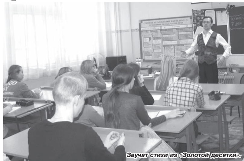
Звучат стихи из «Золотой десятки».