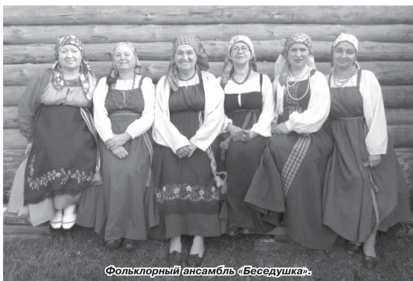
Фольклорный ансамбль «Беседушка».