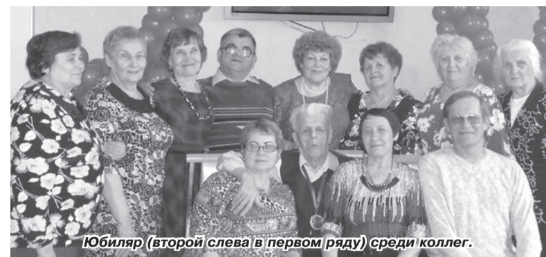
Юбилляр (второй слева в первом ряду) среди коллег.