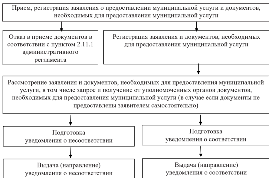
Блок-схема предоставления муниципальной услуги

Приложение 9 к административному регламенту предоставления муниципальной услуги «Направление уведомления о соответствии указанных в уведомлении о планируемом строительстве параметров объекта индивидуального жилищного строительства или садового дома установленным параметрам и допустимости размещения объекта индивидуального жилищного строительства или садового дома на земельном участке»