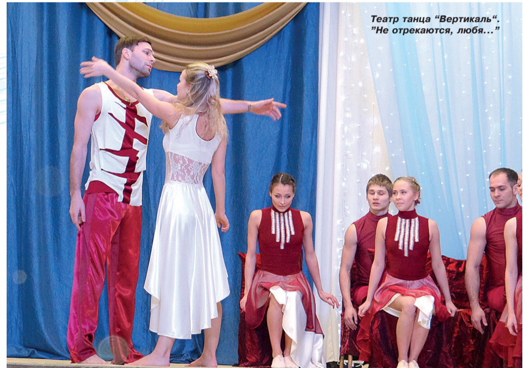
Театр танца «Вертикаль». «Не отрекаются, любя...»

Было видно, с каким трудом даются певцу эти слова, как он едва сдерживает переполняющие его эмоции. Но всё-таки он исполнил песню «Украина – нэнька, матушка –