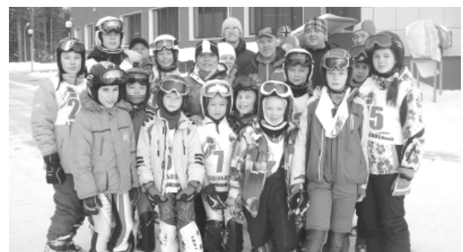
Команда клуба «Эдельвейс».